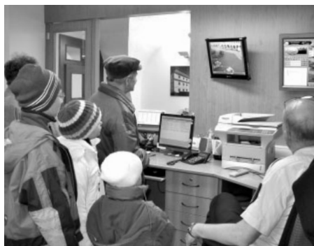
O kamerový systém a jeho možnosti projevily v Den otevřených dveří Městské policie desítky lidí.