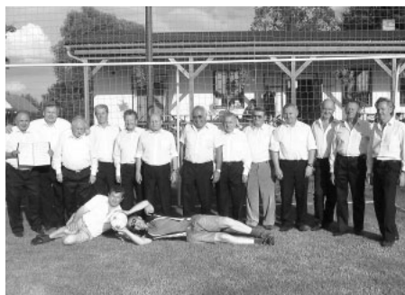
Část zpěváků bratrů Mužského pěveckého sboru Litomyšl bránila branku FK Morašice po vystoupení na Růžovém paloučku 2007, nepřítomní (O. Karlík, Kusý, Janeček, Dvořák a spol.) mezitím lobovali na závěrečném koncertu Smetanovy Litomyšle za vystoupení na jubilejním 50. ročníku.

Jubilejní koncert, na kterém vystoupí také spřátelené sbory, sólisté a malá dechovka BEKRAS zahraje k tanci, by neměl posluchače zklamat. Vstupné včetně občerstvení bude obvyklé! -red-