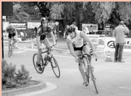
Závodníci v druhém sledu se vydávají na trať cyklistické části závodu.