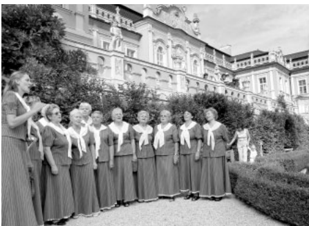
V úvodu výstavy zazpíval ve francouzské zahradě rokokového zámku litomyšlský Sbor paní a dívek.

Při vernisáži byla oficiálně zahájena dražba spolkového quiltu, který společnými silami ušilo 35 členek spolku. "Při jeho výrobě jsme vycházely z tradice šití svatebních quiltů, kterými ženy obdarovávaly nevěstu.