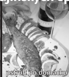
pstruh po domácku