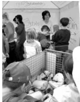
Sběrná místa bývají i součástí akcí věnovaných ochraně životního prostředí.

Odkládaná elektrozařízení musí být kompletní a neporušená, neboť pouze taková budou předmětem příjmů od smluvních partnerů. Například chladnička s vymontovaným kompresorem nesplňuje podmínky zpětného odběru a stává se odpadem. Za likvidaci takového nekompletního zařízení musí provozovatel sběrného dvora naopak ještě zaplatit.