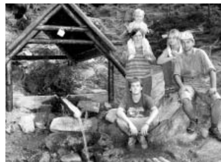
Pracovní tým u Džberky po dokončení oprav.

Cílem tohoto projektu bylo vyčištění a prohloubení studánek, výroba a instalace stříšek nad vodní plochu a instalace informačního panelu s textem o historii a jménu studánky. Záchraná stanice "Pasička", která poskytla mládežníkům zázemí pro jejich činnost a jejich pracovníci též přiložili ruku k dílu, se zaručila nadále o studánky pečovat. -red-