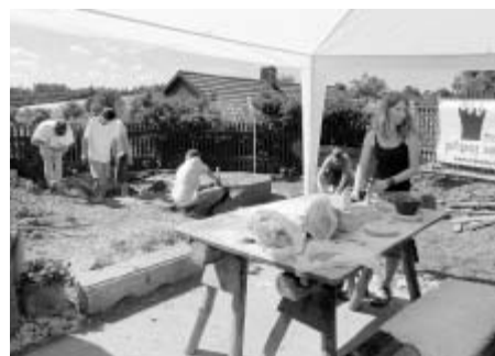
Červencová stavba pravěkých pecí.