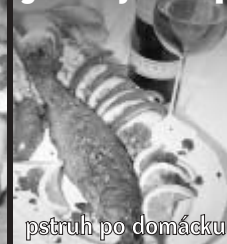
pstruh po domácku