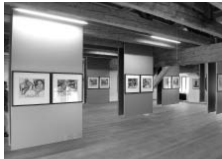
V zámeckém pivovaru bylo vystaveno 56 z celkového počtu 105 tušových kreseb cyklu Člověk a Země

Výstava v rámci Smetanovy výtvarné Litomyšle, kterou 15. června osobně zahájil prezident republiky Václav Klaus a emeritní ředitel Guggenheimova muzea moderního umění v New Yorku Thomas M. Messer, byla v pořadí již osmým zastavením. V pořadí deváté zastavení se uskutečnilo v prosinci tohoto roku ve významném letovisku Punta del Este v Uruguaji. Vernisáž proběhne 29. prosince.