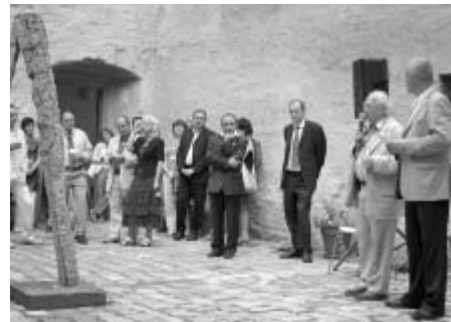
Výstava byla zakončena v rámci oslav 15 let existence společnosti Mach - Líhně kuřat Litomyšl.