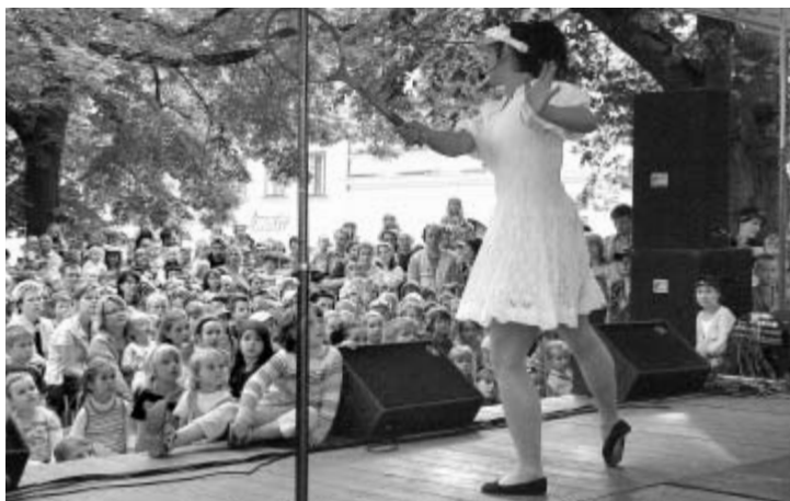
Pohádka Jak Máňa zachraňovala Martina z pekla v podání pražského divadla Andromeda při devátých Toulouvcových prázdninových pátcích přilákala téměř rekordní návštěvu.

Na počátku července skončil 49. ročník operního festivalu Smetanova Litomyšl a symbolicky tak otevřel občanům města i jejím návštěvníkům další pestré litomyšlské kulturní léto.