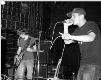
Vítěz minulého ročníku - královéhradecká skupina Enter