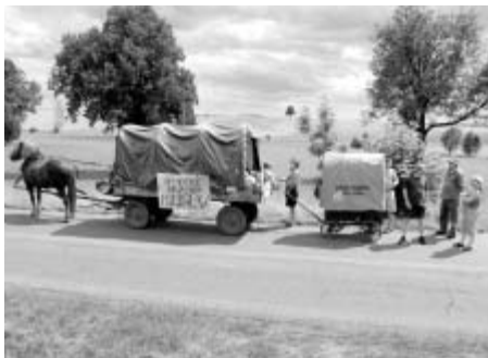
Členové zámeckého divadla na cestách.