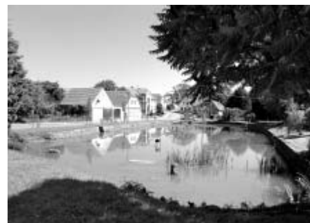
Malebná náves v Újezdci prošla v posledním roce revitalizací.

V sobotu 11. srpna se od 10.30 hodin v obci Újezdec, která si připomíná 840. výročí svého založení, koná sraz rodáků a přátel obce. Blíží informace získáte na tel. čísle 461 633 198.