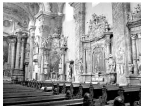
Interiér chrámu svatého Jakuba v Levoči