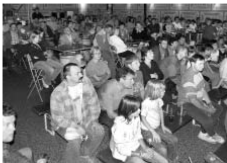
Nepříznivá počasí zahnal 11. července návštěvníky pravidelných středních hudebních pořadů u Smetanova domu do Music clubu Kotelna. Málomomu však tato změna vadila, neboť skupina Xilt hrála opět skvěle.

Již první červencovou středu bylo možné navštívit koncert konaný v rámci Interpretáčních kurzů v zámeckém kongresovém centru a pak téměř denně buď na stejném místě nebo v kostele Povýšení sv. Kříže se konaly kvalitní různorodé pořady vážné hudby. Řada zájemců o tzv. klasickou hudbu si po třítýdenním maratonu operního festivalu nenechala ujít ani koncert Leoše Čepického, který byl jedním z lektorů Interpretáčních kurzů. Přesto i letos zbylo dost prostoru na HuHu večer - tedy Humor v hudbě, který pobavil posluchače v pátek 13. července. Slavnostním zakončením byl Závěrečný koncert Letního orchestru mladých, který v Litomyšli pod taktovkou Jaroslava Brycha pracoval shodou okolností i v témže čase.