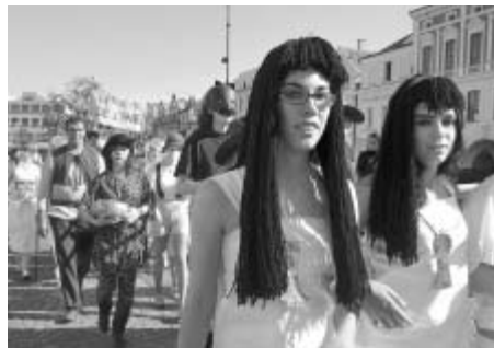
Průvod masek byl tentokrát početně slabší, avšak jejich nápaditost znovu mile překvapila.