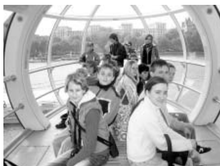
V "Oku" Londýna.

Měli jsme však možnost poznat tuto zemi i z jiné strany. Byli jsme ubytovaní v hostitelských rodinách, které na tři noci nahradily naše domovy. Byla to ideální příležitost, jak poznat anglický způsob života, překonat zábrany a použít angličtinu tváří v tvář pravému a nefalšovanému rodilému Angličanovi.