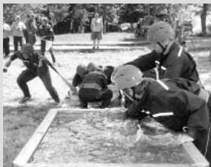
Požární útok je v hasičském sportu jakousi královskou disciplínou.