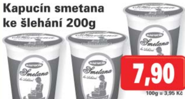
Kapucín smetana ke šlehání 200g