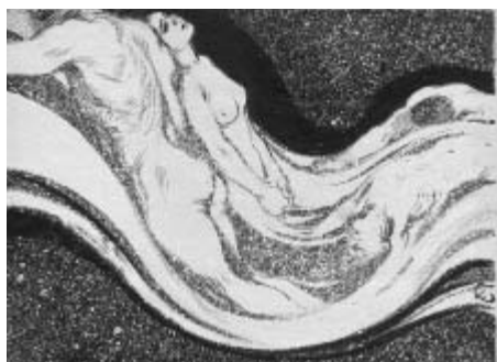
František Kupka: Rytmus dějin

Během studií na L'École des Beaux-Arts se živil malováním plakátů, vyučuje náboženství a dokonce vystupuje jako spiritistické médium (není bez zajímavosti, že Kupka se byl příznivcem teosofie, východních filosofii a mysticismu vůbec). V roce 1914 odchází dobrovolně na frontu, v bitvě u řeky Aisne je raněn. Je vyznamenán