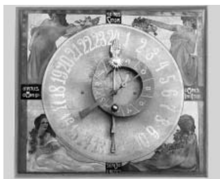
Litomyšlský orloj v roce 1907

uprostřed stran čtverce jsou latinské nápisy, jež při čtení ve směru pohybu hodinových ručiček sestavují větu virtus omni loco nasCitur, omnes InvItat serVos reges . Poměrně kostrbatý překlad textu z roku 1907 nalezneme v litomyšlské městské kronice - Výtečnost na každém místě se rodí, všechny pozývá, nízké i vysoké (doslovnější překlad by mohl znít - Ctnost se rodí na každém místě; všechny vyzývá /vybízí/, otroky i krále) . Nápis je též chronogramem, neboť větší písmena uvádějí v římských číslicích letoopočet 1907. Treba dodat, že dle původní Růžičkovy skici a průvodního dopisu ze 7. května 1907 měly být ženské