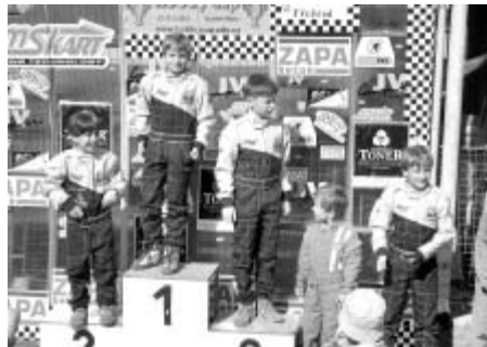
Jezdci A-kart areny na stupních nejvyšších.