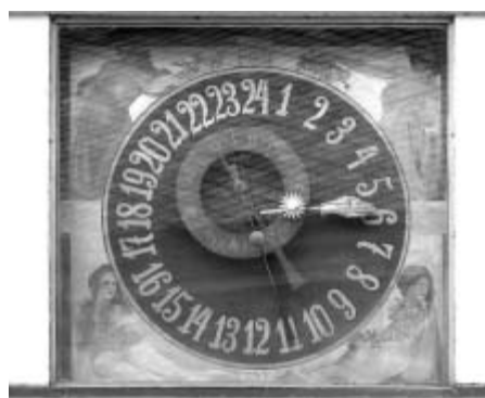
Litomyšlský orloj v roce 2007

V Obzoru litomyšlském z 26. října 1907 neznámý autor o litomyšlském orloji napsal, že "hodiny tohoto systému z celého Rakouska má dnes jen Praha, Olomouc a Litomyšl, kde však byly pořízeny oproti dvěma prvním městům nepoměrně laciněji". Tuto skutečnost potvrzuje mimo jiné zápis v již zmíněné litomyšlské městské kronice, který vycisluje veškeré finanční náklady spojené s pořízením litomyšlského orloje ve výši 795,19 rakouských korun. Poměrně zajímavou informaci o mnohem starších hodinách, resp. orloji na litomyšlské radniční budově uveřejnil - s odvoláním na zápis v jedné z litomyšlských měst-