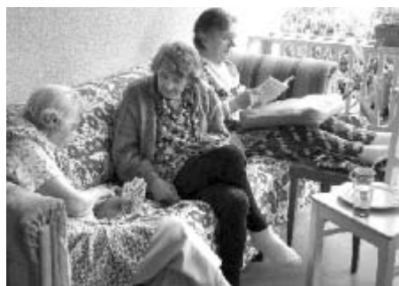
Klientky Denního stacionáře se věnují zájmové činnosti.