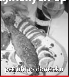
pstruh po domácku