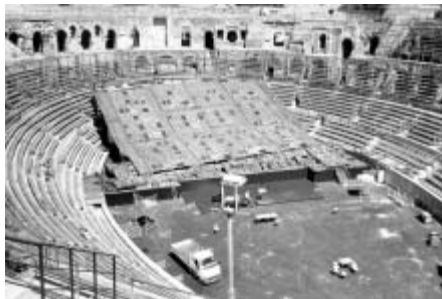
Amfiteátr ve francouzském Nimes před uvedením operního díla Giuseppe Verdiho Aida.

“Mohu odpovědět citací přísahy, kterou skládají noví lékaři: především neuskodit. To znamená při jakémkoliv využití zámeckého nádvoří, včetně využití pro hudební účely, neexistují zásadní námítky, pokud to nepovede ke konstrukčním změnám nebo k ohrožení stavby a její sgrafitové výzdoby. Kdysi se diskutovalo o tom, že plachta, která