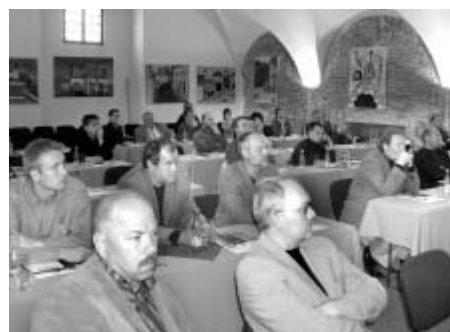
Setkání litomyšlských podnikatelů v Zámeckém pivovaru.

■ Města Litomyšl, Polička, Svitavy, Moravská Třebová a Vysoké Mýto dopracovávají v těchto dnech stanovy nového dobrovolného svazku obcí s názvem Českomoravské pomezí. Zřízení svazku a stanovy musí schválit zastupitelstva všech měst. Až po tomto úkonu může být svazek obcí založen.