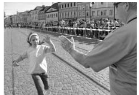
Tradičního hodinového štafetového běhu po Smetanově náměstí se zúčastnily všechny věkové skupiny.