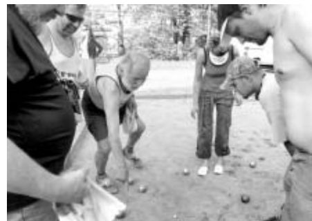
Která koule je blíž? Během utkání se často pásmem přeměřují vzdálenosti jednotlivých koulí od tzv. košonu.