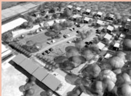
Vizualizace budoucího uspořádání autocampu na Černé hoře.

campu a které mohou sloužit i širší veřejnosti (např. občerstvení). Prostranství pro stany je oživeno hřišti a volnými plochami, které by měly sloužit k setkávání a hrám. Navržena byla i členěná karavanová stání, která budou vybavena přípojkami elektřiny, vody a kanalizace. Ubytování v chatách je dimenzováno přibližně pro 75 osob. Každá chata bude mít vlastní hygienické zařízení a kromě vnitřního obytného prostoru bude mít i zastřešenou venkovní terasu. V rámci areálu je naplánováno minigolfově hřiště, univerzální volejbalové hřiště, lanové a dětské hřiště.