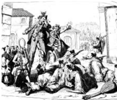
Strakatá komedie vychází z tradiční commedie dell'arte.

Zámecký divadelní spolek Milislav byl založen v roce 1998 při příležitosti 200. výročí vzniku zámeckého divadla v Litomyšli. V témže roce soubor nastudoval