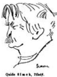
Šimkova karikatura od Ondřeje Sekory.

Klub českých turistů Sloupnice pořádá 8. května 33. ročník pochodu, jehož součástí jsou i cyklotrasy. Pochod startuje od 7.00 do 9.30 hodin z hřiště za Základní školou. Trasy pochodu jsou 8 km, 15 km a 25 km, cyklisté si mohou vybrat podle náročnosti - dětský okruh měří 17 km, malý 45 km a velký 80 km.