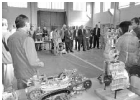
Vedení školy při slavnostním otevření učebny poděkovalo zástupcům kraje i sponzorům.