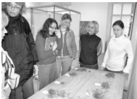
Studentky Zahradnické školy vyzkoušely návštěvníky muzea z jejich znalostí bylinných druhů.

Tradiční soutěž ve sběru a třídění baterií , která probíhá druhý rok jako soutěž o putovní pohár DDM, vyhrály letos děti z MŠ a ZŠ Všeňálka Němčice.