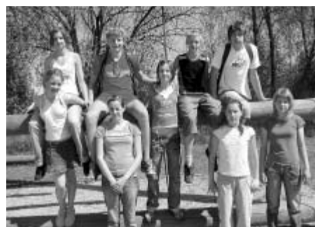
Soutěžní tým III. ZŠ.