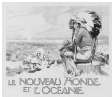
František Kupka - Člověk a Země

V nově rekonstruovaných prostorách Zámeckého pivovaru bude 8. června zahájena stěžejní výstava letošního ročníku Smetanovy výtvarné Litomyšle v rámci připomenutí 50. výročí úmrtí jednoho z největších českých výtvarníků Františka Kupky. Výstava Člověk a země - František Kupka v prostorách Josefa Pleskota přinese návštěvníkům unikátní soubor 105 originálních fascinujících tušových maleb a kreseb, zobrazujících vývoj