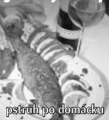
pstruh po domácku