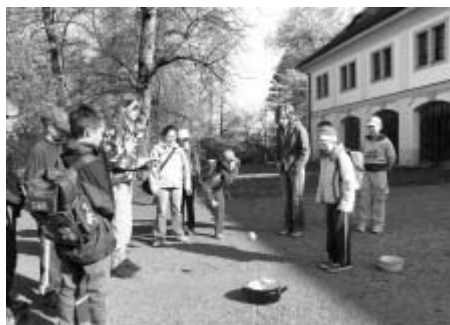
Program v zámecké zahradě patřil hrám v jarní přírodě.