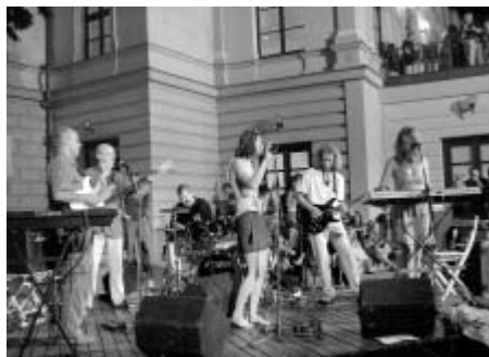
Friends and Sisters