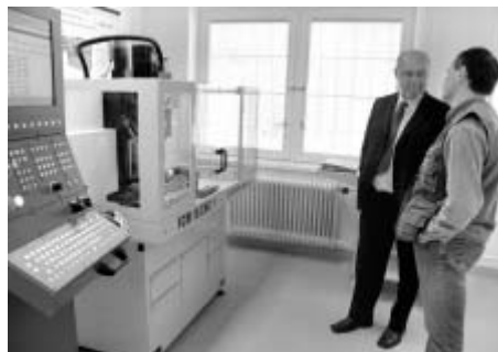
Novou učebnu s CNC strojem si prohlédli také zástupci sponzorských firem.