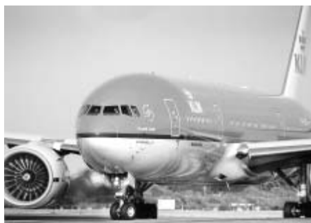
Boeing 777 holandské letecké společnosti KLM „Litomyšl Castle“.