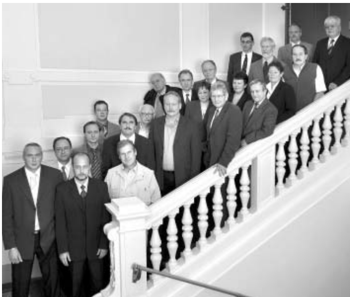
Noví členové zastupitelstva města Litomyšle.