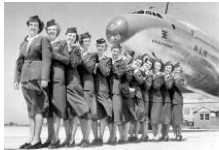
Letačky společnosti KLM pózuji v roce 1950 v Schipholu před letadlem Lockheed Constellation L-749, na jehož trupu je název města Enschede.

V roce 1998 - 120 letadel - 150 destinací v 80 zemích 6 světadílů - 304 miliony km - 13,3 milionů cestujících - 612 000 tun nákladu