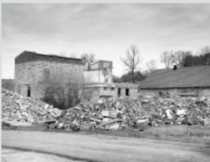
Starý objekt hostince byl téměř zničen...