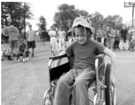
Účastníci parahučky si vyzkoušeli, jaké to je být upoután na invalidní vozík.