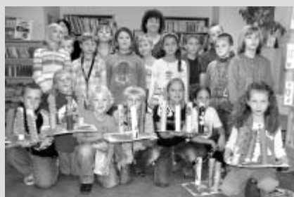
V soutěži Pohádkový les zvítězila 2. třída I. ZŠ.