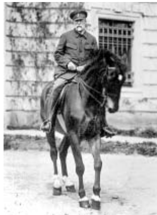
První československý prezident Tomáš Garrigue Masaryk

Po dlouhém křiku vyhrůžek a nadávek telefonoval náš velitel do zázadu k veliteli armádnímu, co má s námi dělat a ten mu odpověděl, aby nás zavedl směrem k domovu na jedno místo, kde by nás bylo použito k zadržení nepřítele z boku fronty. Šli jsme tedy dozadu, ale nevěřili jsme tomu, že jdeme domů, neboť nás stále vedli po divných kopcích. Na všech stranách fronty to dunělo. Naše přední linie utíkala před přesilou italskou. Mnoho našeho vojska bylo zajato a zabito. Naše dělostřelctvo i vozařstvo v trysku ujízďelo dozadu. My jsme šli již dva dny a dvě noci. Šli jsme přes Sevik, které bylo od italských letadel bombardováno a šli jsme dále přes Trient, ale dosud jsme nevěděli, co s námi bude. Třetí den jsme přišli