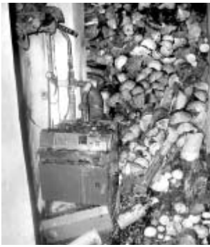
Příčinou nedávného požáru v Horní Sloupnici bylo nevhodně uložené palivo v blízkosti kotle na pevná paliva.

Pro topení nepoužívejte nic, co do kamen nepatří - například biologický či jiný odpad (sláma, umělohmotné lahve apod.). Má to nejen zanedbatelné ekologické důsledky, ale zvyšuje to riziko poškození kotle, kamen, kouřovodu nebo komína, čímž roste i nebezpečí vzniku požáru. V kamnech na tuhá paliva nesmíte nikdy zatápnout pomocí vysoce hořlavých kapalin (např. benzínu), vždy hrozí vznícení hořlavých par. Dejte si pozor, abyste netopili vlhkým topivem. Při spalování například vlhkého palivového dřeva klesá jeho výhřevnost, odpařená voda navíc negativně působí na tepelnou techniku a proces spalování. V případě topidel na tuhá paliva dávejte bedlivý pozor na žhavý popel. Nechte jej zcela vychladnout a pak uložte do nehořlavých nádob (např. kovu), které jsou neporušené, uzavíratelné a umístěné v bezpečné vzdálenosti od hořlavých látek a stavebních konstrukcí z hořlavých hmot. Vyvarujte se ukládání žhavého popela do plastových popelnic, ty se totiž mohou žářem zdeformovat. Kvůli špatnému uložení