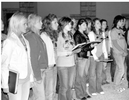
Dívčí pěvecký sbor pedagogické školy z Levoče vzdal hold Jaroslavu Ježkovi na druhém zámeckém nádvoří.

„Jaroslav Ježek je sice komplikovaný skladatel, ale není to jenom tím, že by Voskovec a Werich působili jako ti skvělí textaři. Ona ta hudba sama o sobě je svým