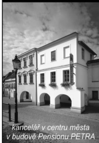
kancelář v centru města v budově Pensionu PETRA

Vyžádejte si aktuální nabídku zakázkových kalendářů, PF, diářů atd. k novému roku 2007!