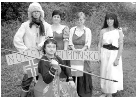
Členky Spolku žen a divadelního spolku Vostřebal v akci.

NABÍZÍM PRONÁJEM GARÁŽE v Cihelně. Tel.: 732 329 398