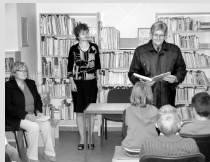
Každoročně Týden knihoven v litomyšlské městské knihovně začíná non-stop čtením. Jako první čte obvykle starosta města Jan Janeček.