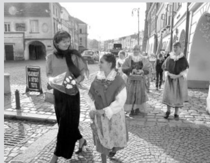
Loňský ročník připomněl 150. výročí prvního vydání knihy Boženy Němcové Babička. Ve středu 5. října se uskutečnil průvod v dobových kostýmech.