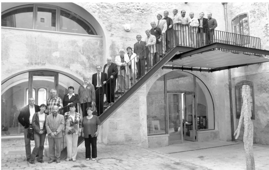
Členové zastupitelstva města, jehož volební období právě končí.

Velká pozornost byla věnována i oblasti zeleně a životního prostředí. Upravena byla alej u Nedošinského háje a třešňová alej U Prokopa, zásadní úpravy se dočkal park na Jiráskově náměstí. Velkým oceněním byla i stříbrná medaile v mezinárodní soutěži Entente florale, ve které se posuzuje kvalita zeleně a životního prostředí vůbec.