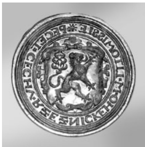
Pečetní deska typáře a celkový boční pohled (SOka Svitavy, Sběrka pečetidel, razitek, jejich otisků a pečetí I. Pečetní typáře a razítka, sign. 11/11).

Před pětadesát lety zahájil samostatný československý stát ražbu prvních mincí. Připomeňme si proto dobu československého mincovnictví jedním z nejzajímavějších nominálů samostatné československé měny. V roce 1925 vytvořil český sochař - představitel kubismu - Otto Gutfreund (1889 - 1927) na tehdejší dobu netradiční návrh československé mince - pětikoruny, jež byla považována odbornou veřejností pro své umělecké ztvárnění za nejpозoruhodnější evropskou minci té doby.