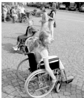
Jaké to je na vozíčku...

Součástí Evropského týdne mobility v Litomyšli byla také nabídka Domu sportu Stratílek, který půjčoval kola za 50 procent ceny půjčovného, cvičná jízda na invalidním vozíku či pohyb po městě se zdravotním postižením. V pátek 22. září byla v rámci Evropského dne bez aut Městská hromadná doprava v Litomyšli zcela zdarma a Dům Sportu Stratílek uskutečnil na parkovišti před plovárnou velký test