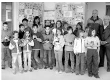
Předávání odměn všem účastníkům vyhlášené výtvarné soutěže maleb a kreseb ze včelařského oboru.

Jakou tedy můžeme očekávat budoucnost chovu včel? Od zájmu veřejnosti o včelí produkty a jejich zhodnocení se odvíjí i jejich výroba a zájem včelařů je těžit. Jedno je však velmi cenné pro včelaře i konzumenty. Včely samy snáší med jen pro svoji potřebu jako zásoby na zimu, jak jim instinkt velí, ne pro obchod s medem. To znamená, že vždy vytvářejí med nejvyšší kvality, kterou jim lokalita umožňuje. Pro nás to znamená, že včely nám budou vždy dávat jen kvalitní, přírodní a přirozený produkt. Tomu můžeme vždy věřit. Proto i kvalita medu přímo od včelaře je také nejvyšší. Chcete-li jíst plnohodnotný med (případně i využívat jiné produkty), nakupujte je co nejbližší včel, tedy u výrobce. To bude i zárukou, že se včely z naší přírody nevytratí. Ve „vyspělých zemích“, na západ od našich hranic, se malovčelař ze záliby již téměř nevyskytuje, to je již nějaký čas známé. Tím ani rozkvetlé zahrádky včelami nebzučí, stromy kvetou a v nich je ticho. Neoplozené ovoce je nechutné a scvrklé, takže se zahrady ruší a místo nich se vysazují parky. Je známo, že tam kde nejsou včely, se ráz krajiny pomalu mění. Takovou budoucnost bychom si nepřáli. U nás je ještě relativně včelařů dost a naše organizace tomu aktivně napomáhá. Stanislav Tomšíček