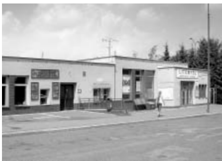
Autobusové nádraží v podobě, v jaké jsme ho znali dvacet let, bude už zanedlouho minulostí.

Vánoční trh si nechce nechat ujít ani Billa, která plánuje kolaudaci předběžně na začátek prosince tohoto roku.