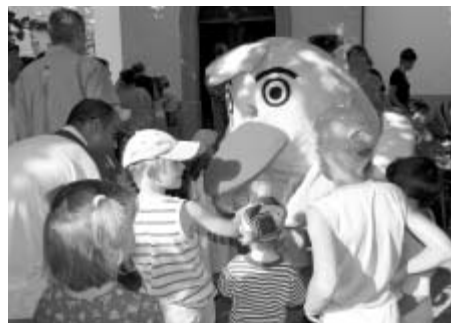
I letos vybírá Kuře pomocníček do kasičky dobrovolné vstupné, jehož výtěžek odešleme na konto Pomozte dětem.

PEN klubu a že se živí také jako překladatel. V každém případě se můžeme těšit na zajímavý večer plný chytré a vtipné muziky i textů. Další pátek nás čeká Vyprávění starého stromu v podání divadla Matěje Kopeckého z Prahy a koncert valašskomeziříčského Docuku. Docuku znamená ve valašském nářečí svíznost a skočnost - kdo hádá, že tento večer bude patřit lidovkám a jejich fúzi s bigbitem, hádá správně. Nenechte si tedy ujít valašské, slovenské, ale třeba i maďarské lidovky, které vám zahraje skupinka hudebníků, zástupců různých žánrů, Docuku. Předposlední pátek zde bude hrát slovenská formace Heaven 's Shore. Jde o jedinou křesťanskou skupinu na Slovensku, která se živí hudbou. Kapela je složena z několika hudebníků různých denominací a národností. Koncert je pořádán ve spolupráci s organizátory Celostátního setkání animátorů, které se bude konat v Litomyšli