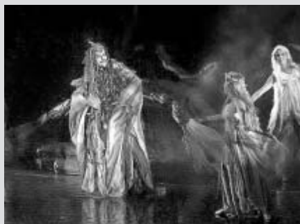
Rusalka v úspěšném režijním zpracování Zdeňka Trošky

„Využití filmové projekce v pozadí zde splnilo své poslání beze zbytku - a dokonce občasné padání deštových kapek na zakryté hlediště v prvním dějství působilo velmi autenticky - vždyť přece děj se tam odehrává kdesi na břehu vodní říše... Troškovo využití dýmování na jevišti v uzavřeném prostoru občas rozkašle nejednoho přítomného diváka - tady se však plyn v přírodním prostředí dokonale rozpíval v opravdu surrealistickém prolínání, takže jsme byli svědky úchvatné scénérie, opravdu pohádkově vypointované v duchu nezapomenutelných kašíkovských tradic,“ napsal kritik, který z pěveckých výkonů ocenil především