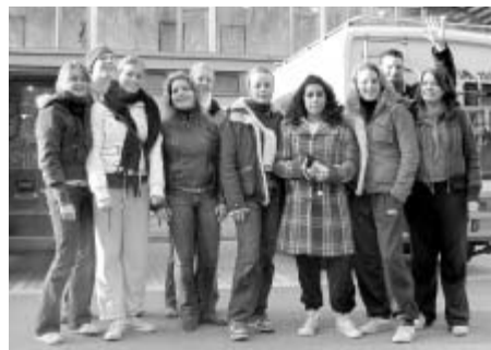
Studenti Gymnázia A. Jiráka s holandskými přáteli.

Stejně jako naši holandské přátelé, také my jsme uspořádali poslední společnou večeři a potom zašli ještě na bowling. V pátek jsme se loučili snad víc než v Holandsku, tentokrát už jsme neměli jistotu, že se někdy ještě uvidíme, ale jisté plány do budoucna by tu snad byly.