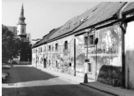
Stav zámeckého pivovaru počátkem devadesátých let