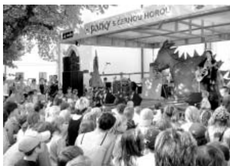
Pohádky a koncerty se od letošních prázdnin odehrávají pod novým zastřešením pódiá.