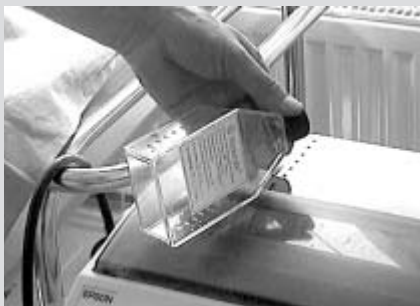
Malé larvičky dodává litomyšlské nemocnici specializovaná česká firma v plastových kontejnerech.