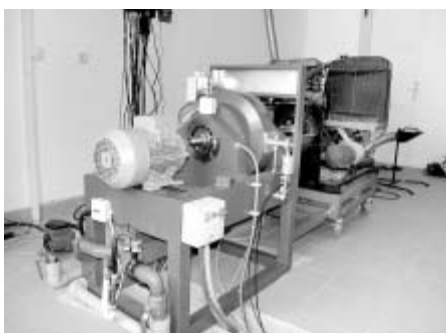
Nová zkušebna motorů ve VOŠ a SOŠT v Litomyšli nabídne studentům moderní způsob diagnostikování hnací jednotky při nastavení různých parametrů.