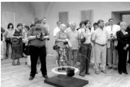
Loňský ročník Smetanovy výtvarné Litomyšle zaplnil uměním řadu výstavních prostor v celém městě.