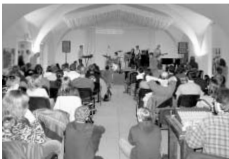
V Zámeckém pivovaru probíhal Večer radosti a vděčnosti aneb Bigbitové chvály

Akce, kterou Bratrská církev pořádá každé dva roky, má mladé křesťany povzbudit v jejich víře, je pro ně vítanou možností setkat se, lépe se poznat, inspirovat se a při bohoslužbách, seminářích, kulturních pořadech či sportovních hrách se navzájem sdílet a pobavit. Téma, nad kterými se mladí lidé společně zamýšlejí, jsou poměrně vážná a zároveň blízká každodennímu životu. V rámci sjezdu se uskutečnila řada přednášek a desítky volitelných seminářů na nejrušnější, často kontroverzní témata (Tlak vrstevníků, Kde vzít a nekrást počítačový software, Okultismus, Život v závislosti, Co se 4% a mnohé jiné). Nejinak tomu bylo v představení Inky Marešové a Petry Peškové ze sdružení RestArt z Písku, která v Orion Areně uvedla hru s názvem Big Father. „Šlo v podstatě o parodii reality show Big Brother. Není to však on, kdo Tě stále sleduje, ale Bůh Otec, který vi-