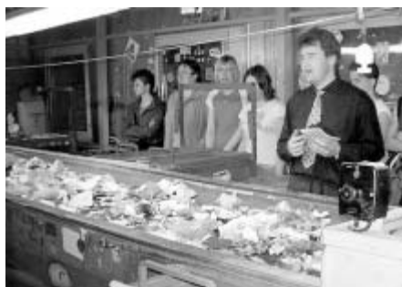
Pro učitele a jejich studenty se uskutečnil výjezd s výkladem do společnosti zabývající se tříděním odpadu.