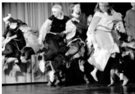
Muzikál Jákob v podání mladých divadelníků z Českého Těšína v Lidovém domě.

-ih- foto Michaela Severová a Ivan Hudeček