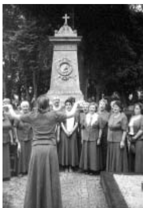
Pomník M.D. Rettigové byl před několika lety opraven. K uhrazení nákladů přitom pomohla i sbírka uspořádaná Sbohem paní a dívek v Litomyšli.