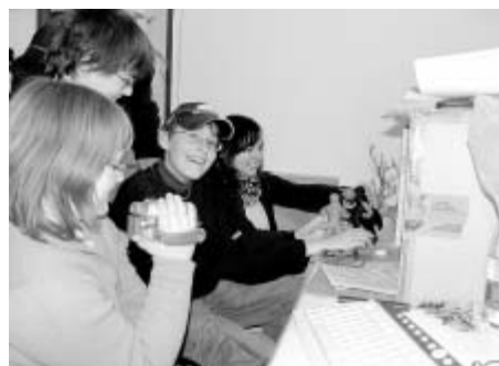
Skupina mladých animátorů při práci v klubovně Domu dětí a mládeže v Litomyšli.