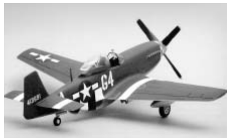
Model letadla P-51 Mustang