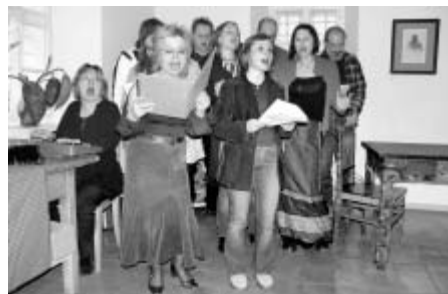
Při vernisáži zazpívali úryvky z divadelního zpracování Krvavého románu členové ochotnického spolku Filigrán.