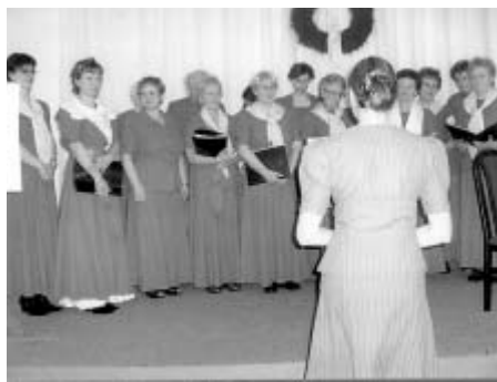
Sbor paní a dívek při svém vystoupení.