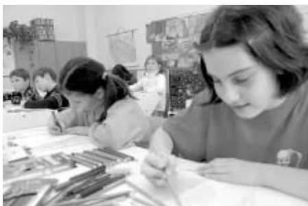
Stonožkové děti nedávno kreslily obrázky pro své kamarády z oblastí postižených ničivým zemětřesením.