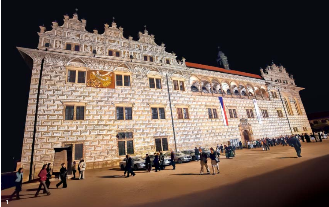
1) zámecké nádvoří