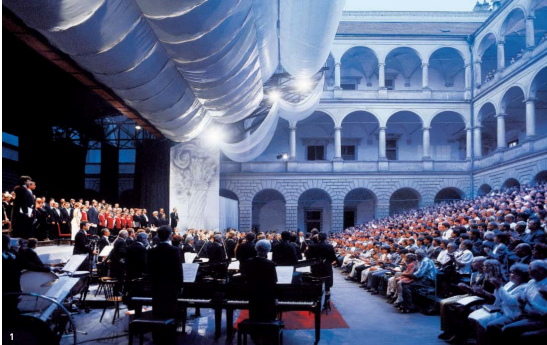
1) Mezinárodní operní festival Smetanova Litomyšl

Litomyšl je rodištěm skladatele Bedřicha Smetany, malíře Julia Mařáka i mnoha dalších osobností, které se proslavily především na poli umění a vědy. Smetanovo jméno je zde trvale připomínáno jednak památníkem v zámeckém pivovaru, jednak operním festivalem, pořádaným každoročně v areálu zámku.