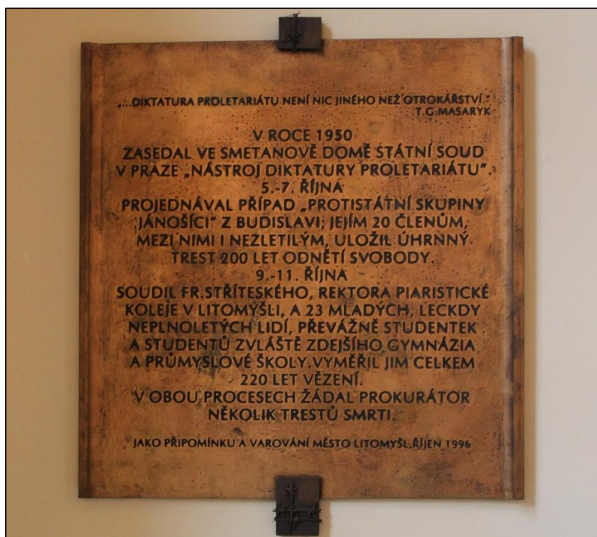
Foto 9: Pamětní deska připomínající politické procesy v Litomyšli umístěná ve Smetanově domě, místě konání procesů