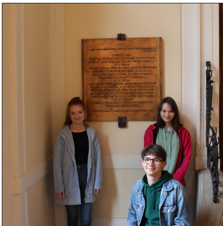
Foto 10: Žáci ZŠ Zámecká u pamětní desky připomínající politické procesy v Litomyšli umístěná ve Smetanově domě, místě konání procesů