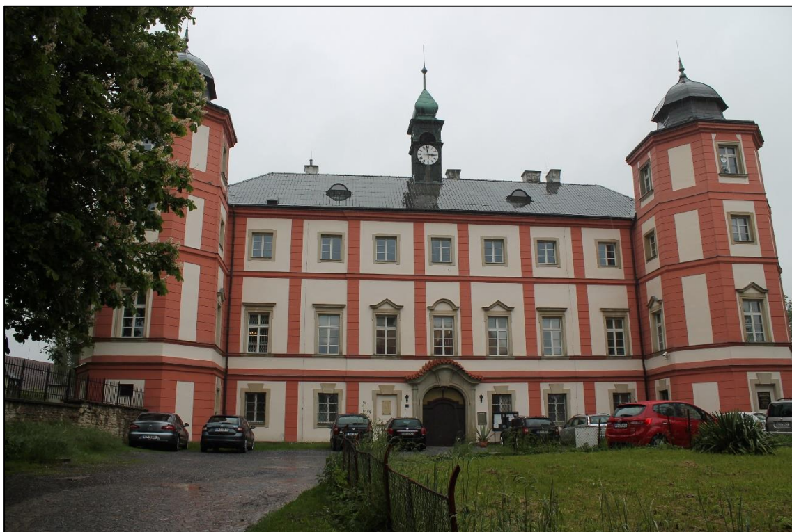
Foto 11: Zámek Zámrsk, dnes sídlo Státního oblastního archivu Zámrsk, v 50. letech vězení pro mladistvé